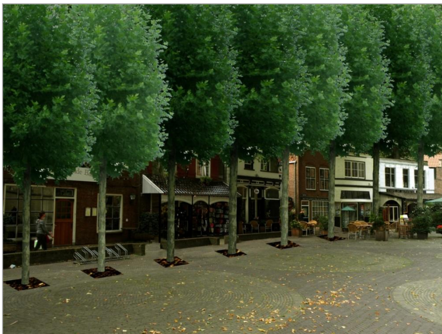
Foto 6: alternatieve situatie op de Kleine Markt met knotplatanen.

Om een rustig beeld en eenheid te creëren, is het aan te bevelen dezelfde bomen op de Kleine Markt te gebruiken. Op deze manier ontstaat een ander beeld op het plein; platanen hebben namelijk een groot blad, wat vrij massaal overkomt. Ook deze bomen zijn bladverliezend en geven bloem- en vruchtresten. Verder kan er, door de viltige beharing van de onderzijde van het blad, allergische reacties ontstaan. Al deze 'overlast' komt bij alle soorten bomen voor. Toch zal de overlast beduidend minder zijn, omdat het om kleinere vormbomen gaat. Deze bomen zullen wel jaarlijks gesnoeid moeten worden.